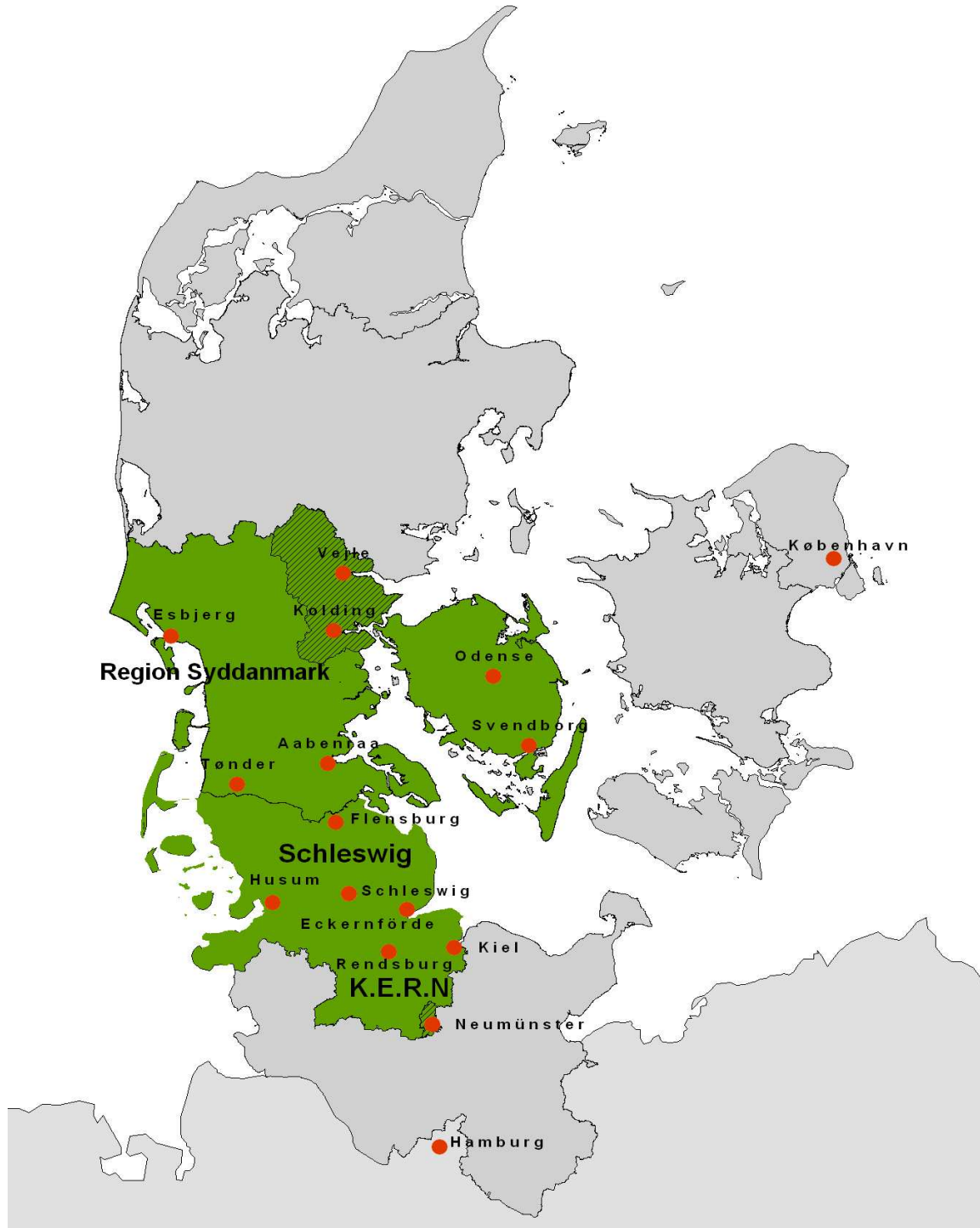
Abb. 1 Karte der Programmregion

Träger des Programms sind die Region Syddanmark, die Stadt Flensburg, die Kreise Schleswig-Flensburg, Nordfriesland, und Rendsburg-Eckernförde, die Landeshauptstadt Kiel und die Stadt Flensburg. Die deutschen Programmträger haben der Entwicklungsagentur Nord GmbH (EA Nord GmbH) in Flensburg und der Wifö in Kiel die Umsetzung des Programms auf deutscher Seite übertragen.